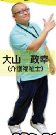
大山 政幸 (介護福祉士)