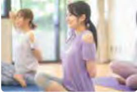
| ヨガ・ストレッチ