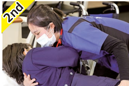
2nd 2回目は 移乗介助 。自立支援を意識しながら安全な移乗を心掛けます。