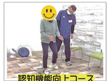
認知機能向上コース

ご利用様が「歩ける」ようになることを目指し、住み慣れた横手市で「元気に暮らせる」様に、 個別リハビリはもちろん、小集団リハビリにも力を入れております。