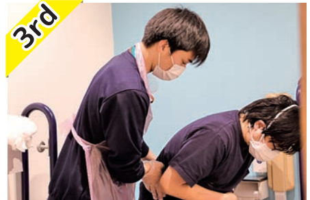
3rd 最終戦は 排泄介助 。心と身体のケアを大切にサポートをします。

新人研修や日々の業務で習得した 介護技術を振り返り 、仲間と共にさらにブラッシュアップさせていく披露イベント『 新人王決定戦 』が開催され、3月に幕を閉じました！仲間と一緒に協力し合う楽しさが実感できたり、新人王を目指して努力することで、自身の技術力アップと自信になるイベントです。