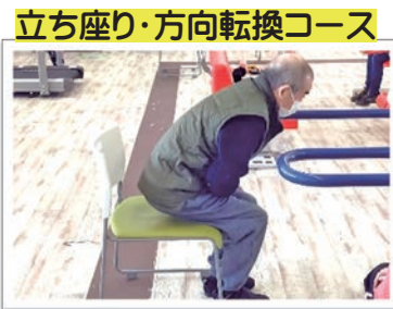
立ち座り・方向転換コース