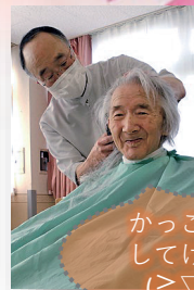
かっこよくしてけれ~ (≧▽≦)