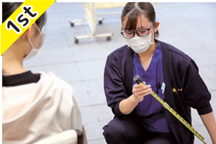
1st 初戦は 歩行介助 がテーマでした。安全・安心を心掛けて介助します。