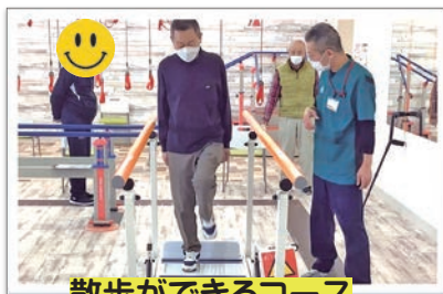
散歩ができるコース