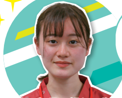
入社2年目の頼れる先輩 CWとして活躍中!