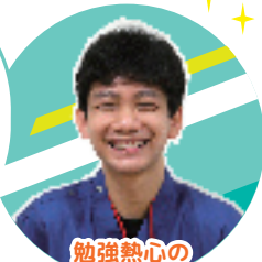
勉強熱心の CWとして活躍中!

就職先を決める中で、 気づきを得て 考えをまとめることが 自分にとって、 大変な作業でした。