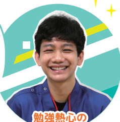
勉強熱心の PTとして活躍中!

整形への就職を希望していたけど、 今回でもう少しいろいろな視点から 考え直そうと思った。