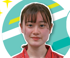
入社2年目の頼れる先輩 CWとして活躍中!