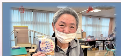
バレンタインデー